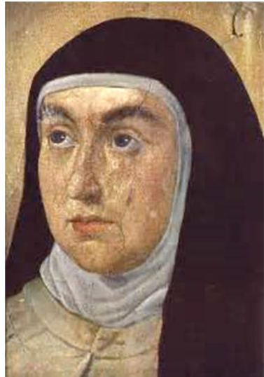
Mujeres de ánimos virtuosos y fuertes... como ella.

Consecuentemente, Dios deja de tener importancia, de estar en el primer lugar. Ese espacio ha sido ocupado por el hombre. El primer mandamiento ya no es amar a Dios sobre todas las cosas, más bien es te amarás a ti mismo