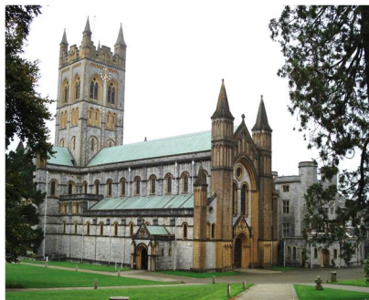
Abadía de Buckfast, en Buckfastleigh

Allí resonó la voz valiente y ardiente de este León de Cristo : Es una realidad que «la crisis en el mundo de hace 100 años, cuando Nuestra Señora se apareció en Fátima, continúa hoy y también ha infectado la vida de la Iglesia».