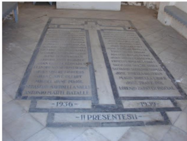
Cementerio nuevo de Olesa, losa con los 38 vecinos asesinados (1936-39)