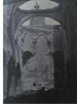
Estado de la Parroquia de Olesa, incendiada en 1936