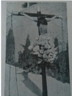
DEVOTA IMAGEN DEL SANTO CRISTO venerada en nuestra Iglesia Parroquial y que fué pasto de las llamas en la quema de la misma