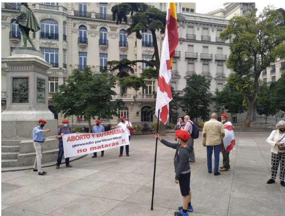
Rosario por la vida en Madrid - junio 2021

22, 25 y 29 mayo - Rosarios por la vida en Sevilla, Pamplona y Madrid.